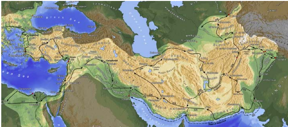
Kaart 1: Het Griekse Rijk in de tijd van Alexander de Grote