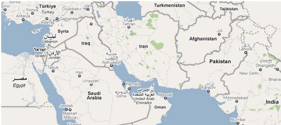
Kaart 2: Het Midden-Oosten vandaag (2010)